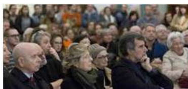
All'Accademia Ligustica dove si terrà venerdì 12 aprile alle 16 l'evento "Gioiello, abito, corpo. Riflessioni sulle tipologie e sui materiali".

Genova - Quanto cambia a livello artistico uno stesso oggetto se realizzato in un materiale piuttosto che in un altro? E come muta il significato in base alla relazione che ha con l'ambiente? Se poi l'opera d'arte in questione è un gioiello il rapporto tra l'oggetto e il soggetto che ne fruisce è ancora più stretto. "Gioiello, abito, corpo. Riflessioni sulle tipologie e sui materiali" è proprio il titolo dell'evento di venerdì 12 aprile alle 16 all'Accademia Ligustica di Belle Arti.