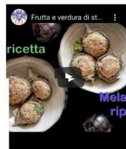
Al Centro agroalimentare di Genova per scoprire i segreti dei prodotti di stagione. MELANZANE - La ricetta dei RIPIENI DI VERDURE.