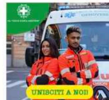
Sulla homepage di GenovaQuotidiana, uno spazio gratuito a rotazione ogni due settimane per le associazioni di volontariato. Clicca qui per sapere come ottenerlo.