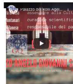
Palazzi dei Rolli - PALAZZO ANGELO GIOVANNI SPINOLA in via Garibaldi. Uno dei palazzi più belli, patrimonio dell'Umanità UNESCO.